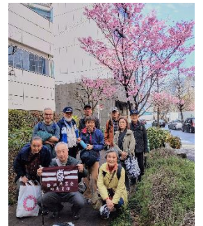
枝の先端にほんの2、3輪咲いている桜を見つけては大いに喜び、陽光(ヨウコウ)という品種の桜が早咲きで色鮮やかに咲いていたので記念写真も撮りました。こんなお花見でしたが人混みも無くゆったりと話しながら、休みながら、ゴールの門前仲町駅に到着しました。

その後、甘酒横丁、小網神社を通り、水天宮横で人形焼きを買っている頃にはすっかり青空になっていました。