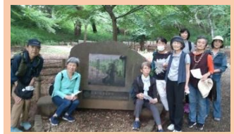
SCあじさいの原点 あじさい鑑賞 高幡不動尊散策

ャンブルの融合した魅力を味わいながら大いに盛り上がり、騎手と競争馬達にも感動した回となりました。