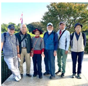
38年卒の皆さん集合

山手公園で持参した軽食を取り、その後は横浜観光定番の外人墓地、港の見える公園、山下公園まで歩き、最後は2年前にできた横浜工