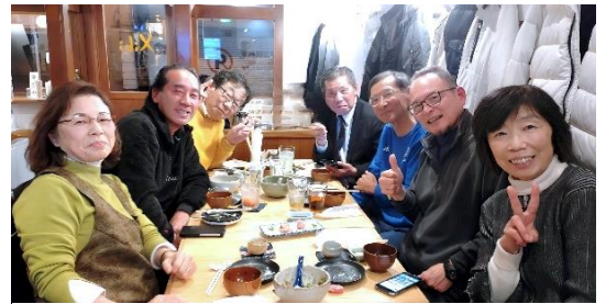
同期の仲間をもっともっと増やしたい

自己紹介の後は懐かしい高校時代の話題で盛り上がり、新たな仲間を加えて楽しい宴となった。5年前に運営役員を引き受けたことで、最初は1人で集めた同期メンバーだが、新しいメンバーも含めて、皆がまだ未知の関東在住同期に声をかければ、同期の輪は益々広がっていくことになる。高校時代は会話しな