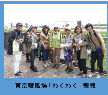
東京競馬場「わくわく」観戦

令和5年はコロナウィルス感染もある程度落ち着いた事もあり、4月には府中の東京競馬場に繰り出し、同窓会関東支部30周年記念企画の補助金一人千円を利用して馬券を買い、3年前に中止になった「わくわく観戦」に再チャレンジすることができました。