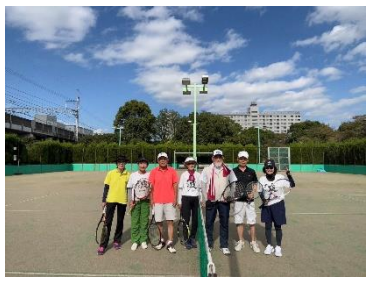
第93回青空のもと集合写真