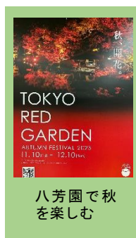
八芳園で秋を楽しむ

次に向かった八芳園では趣のある日本庭園の紅葉を楽しみ、カフェではちよつとリッチな気分であったり談笑できました。