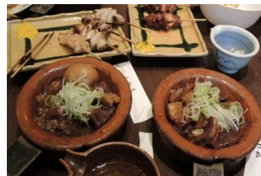
驚きの絶品もつ煮込みに大満足

「乾杯」の音頭で看板メニューの「もつ煮込み」「やきとん」のほか、自家製燻製盛り合わせやグリーンソーラダ、ポテトチーズなどを肴に生ビール、日本酒(磯自慢等)、焼酎などで喉を潤した。