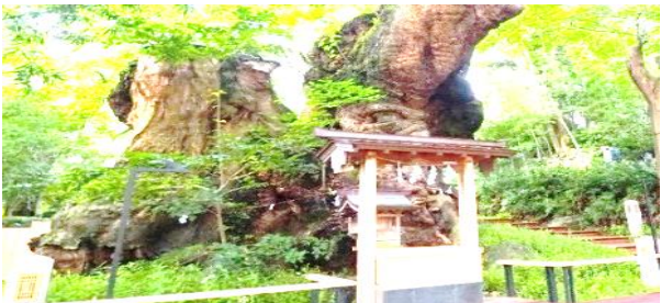
来宮神社 『大楠』 樹齢 2100 年以上のパワースポット