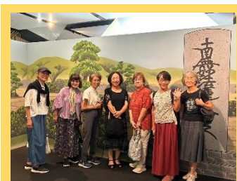
銀座に集合・歌舞伎座見

6月は「SCあじさい」命名時の初心を思い起こし、日野市のあじさいの名所「高幡不動尊」を訪れ、あじさい鑑賞をしながら境内を散策しました。美しい庭園のお茶室では、お抹茶のおもてなしを体験して素敵なお時間を過ごしました。