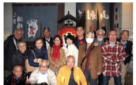
行列のできる人気店「山利喜」の前で

特に、飴色に煮込まれた濃厚なもつ煮込みは、新鮮な「もつ(シロとギアラ)」のみを使用し、それに関西のどて焼きをイメージして豆味噌を使いブーケガルニや赤ワインを加えたフランススタイルのハイブリット煮込みで、参加者からは、「トロトロ、アツアツのもつ煮込みを美味しく食べた」とか、「もつ煮込みのつゆをフランスパンのガーリックトーストにつけて、トースト2枚3枚と続けて堪能した」との声が聞かれた。また、やきとんも種類(たん、はつ、かしら、しる、れば、軟骨等)が多く、「久しぶりにお腹いっぱい食べた」との声も聞かれた。会の話は、何といつても