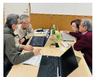
編集作業中の様子