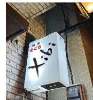
シビは焼津出身の店主が営む同窓生が集う店、R6.2借1.くも開店